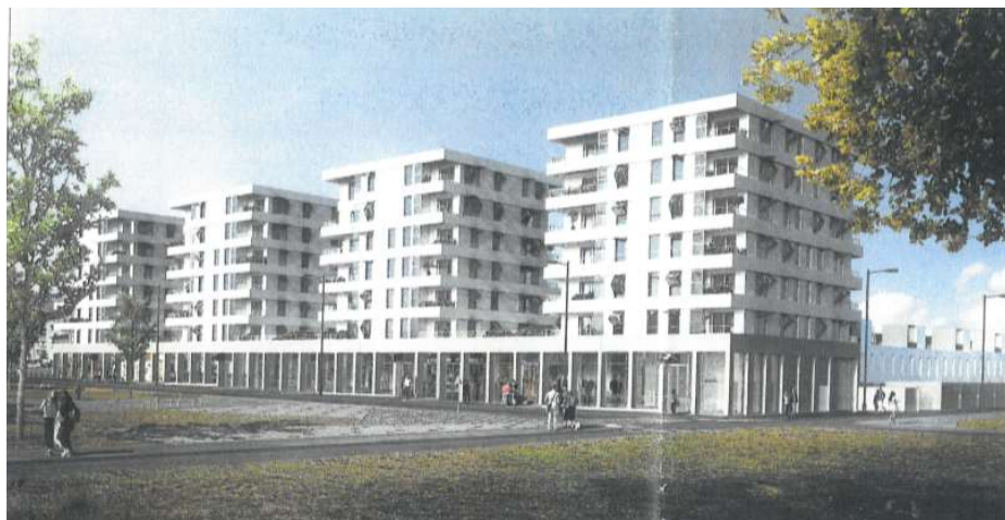
Première tranche avec 4 « plots » à 7 niveaux

Une « information-médiation » a été menée sur les espaces verts face à cette construction et sur la destination des rez-de-chaussée de l'immeuble qui n'a pas eu d'incidence sur le projet.